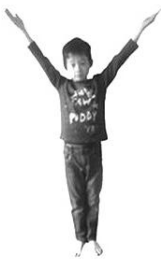
die in de hemel zijt