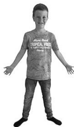
Maar verlos ons van het kwade