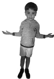
Uw rijk kome