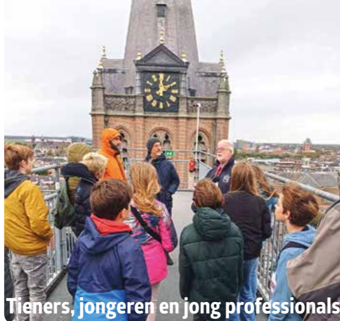
Tieners, jongeren en jong professionals

Regelmatig zijn er activiteiten en bijeenkomsten voor de jongeren. Afgelopen seizoen zijn de tieners bijv. op een zondag naar de Mis in de Sint Jan in Den Bosch gegaan. Na de Mis konden ze de kerk 'beklimmen' via de stijgers die deze maanden toegankelijk zijn. Mooi om de beelden op het dak eens van dichtbij te bekijken. De jongeren hadden broeder Stefan uitgenodigd om over zijn weg naar het religieuze leven te vertellen. De young professionals werden bijgepraat over het synodaalproces en hebben een andere keer de film Des Hommes et des Dieux gekeken over de trapisten-martelaren in Algerije. Ook in 2024 zullen deze groepen de nodige activiteiten organiseren. informatie daarover zie: www.facebook.com/RKJLeiden/