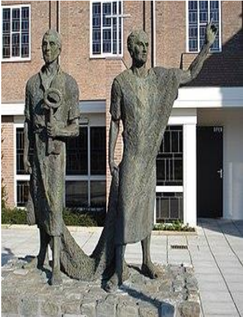
H.H. Petrus en Paulus

Hij die alles zal zijn in allen heeft ons bestemd om, aarde, jouw aanschijn te vernieuwen.