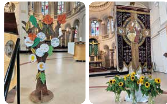
Het Zonnelied inspireerde de kinderen om tijdens de kinderwoorddienst (KWD) een boom